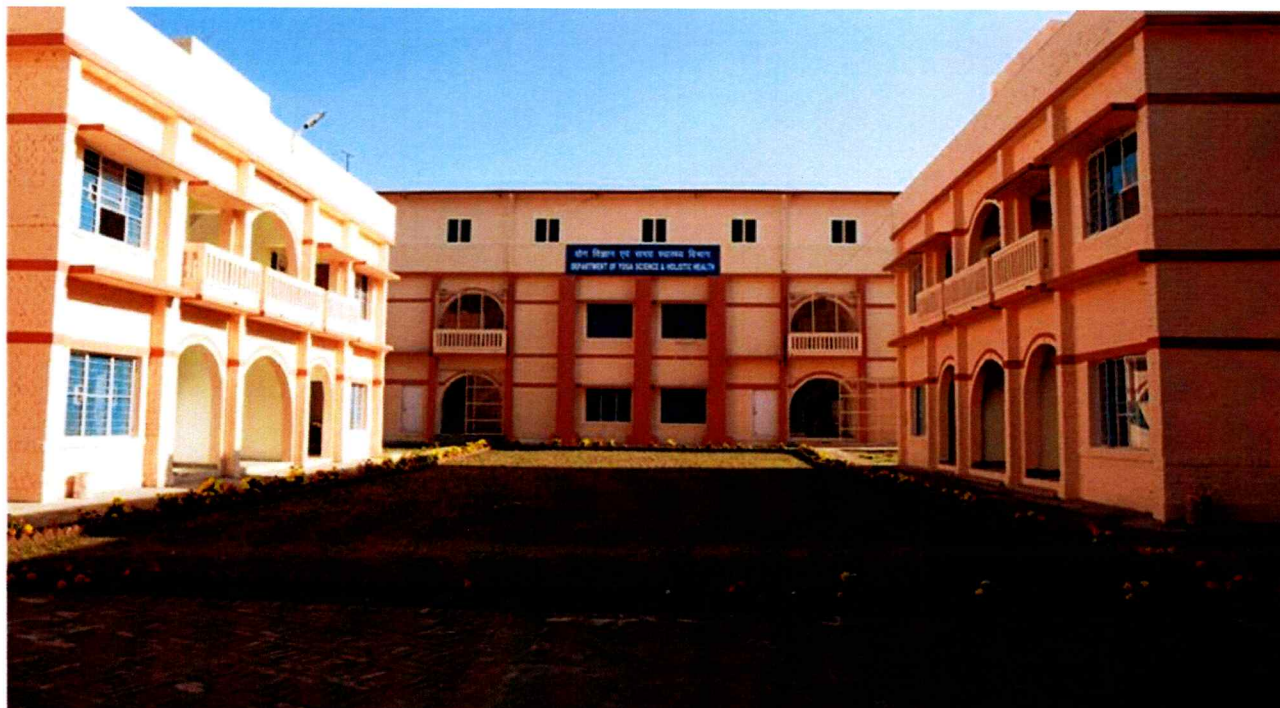
Figure 6: Himalayan School of Yogic Sciences