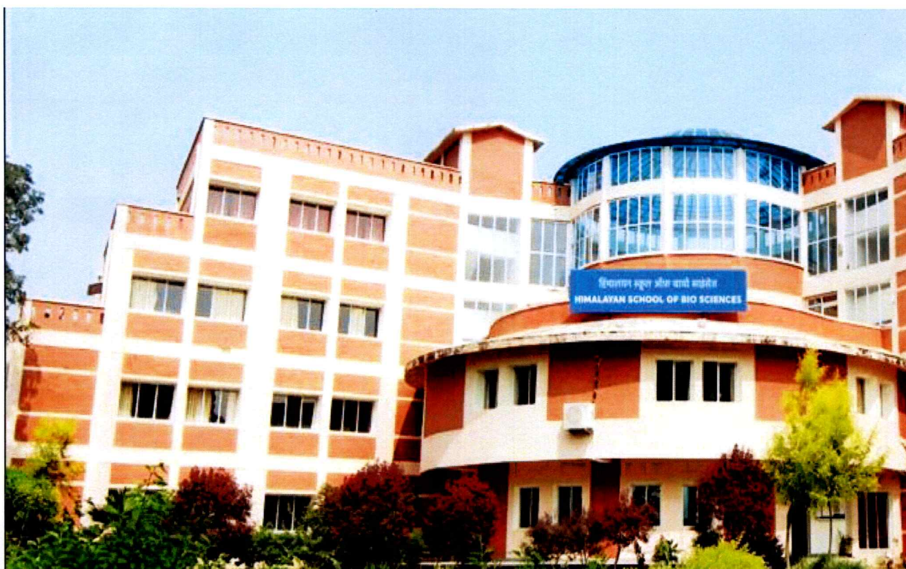
Figure 5: Himalayan School of Biosciences (a Constituent Unit of SRHU)